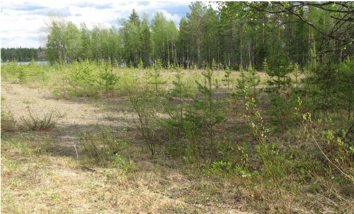
Näkymää tilan pohjoisrajalta kaakkoon

SODANKYLÄ, KERSILÖ 758-403-0006-0008 Murtola