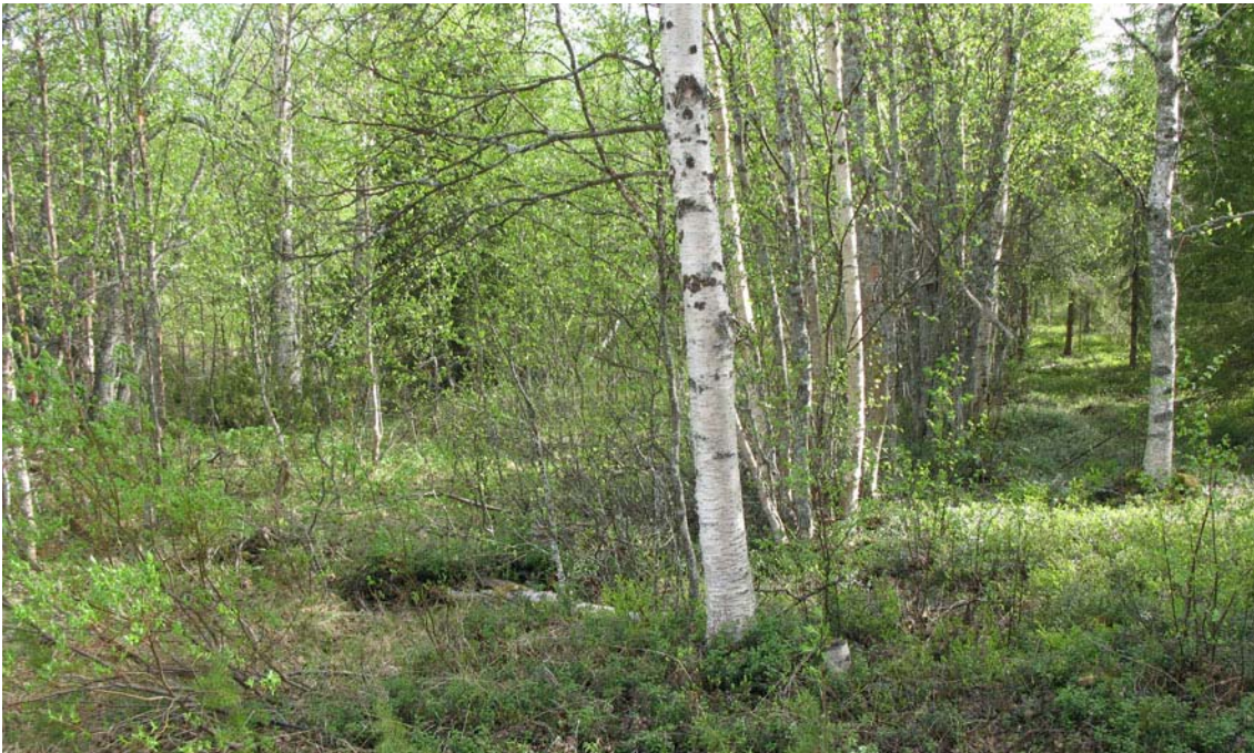
Näkymää tilan länsirajalta