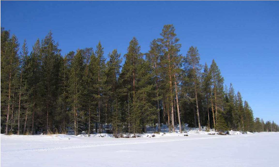
Näkymä järveltä rakennuspaikoille

KEMIJÄRVI, Isokylä 320-403-0116-0010 Kemijärven-Put aansuu (määräala)